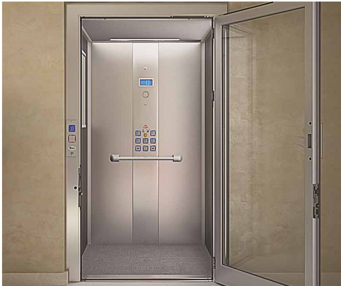
El elevador E10 EcoVimec está dotado de un sistema de rescate automático en caso de fallo en la red eléctrica.

Este elevador es de los denominados MRL, es decir, sin cuarto de máquinas ni contrapeso,