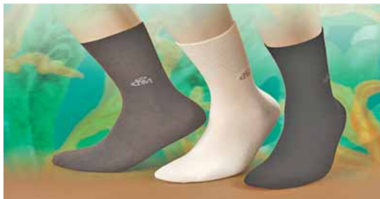
La peculiar composición de estos calcetines genera su eficacia terapéutica (FOTO S21).

Además, estas prendas ostentan certificado médico de garan-