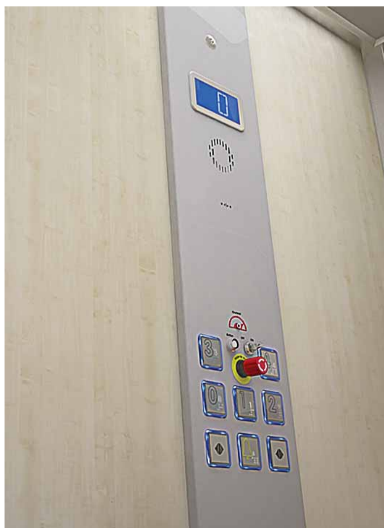
El equipo permite hacer llamadas automáticas desde el elevador.

Además, el equipo eléctrico dispone de la opción de puertas automáticas en cabina y piso, permitiendo hacer llamadas automáticas desde el elevador.