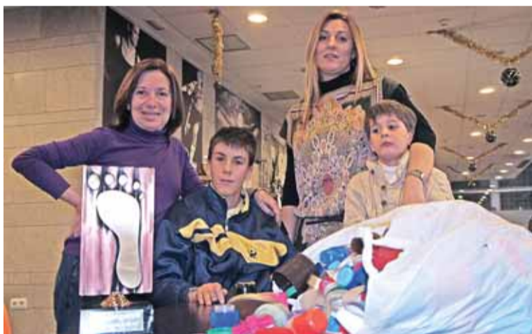
Los tapones recogidos financian la investigación de la enfermedad.

Recogen miles de tapones de plástico para intentar curar a sus hijos página 19