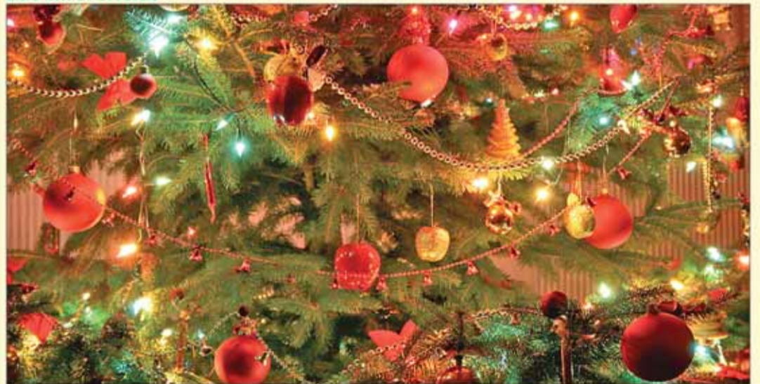
Encuentra siete diferencias entre estas dos imágenes.