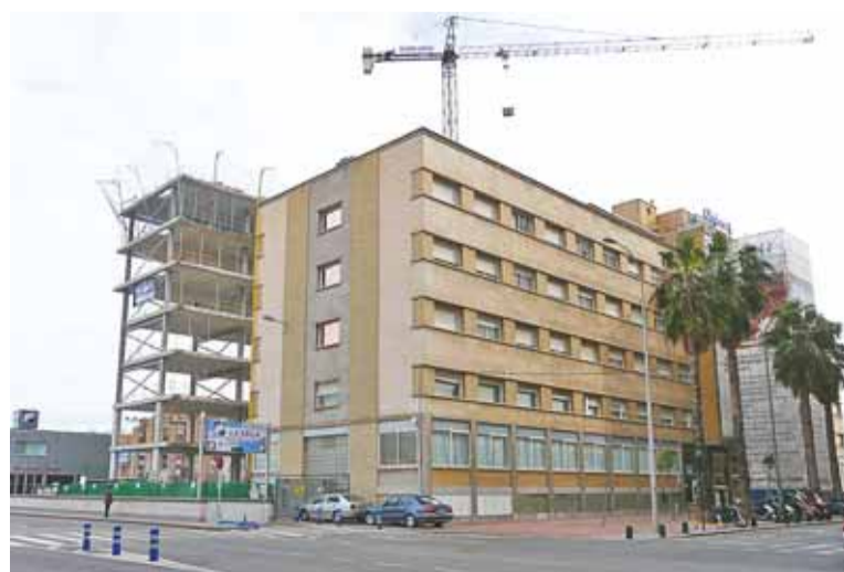
El Hospital La Vega se está ampliando para aumentar sus servicios.

📍 El sistema público sanitario y la gestión privada resultan complementarios