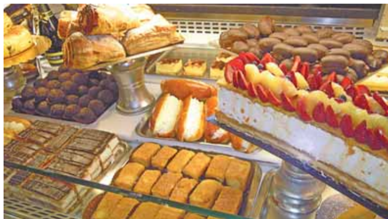
Los excesos alimenticios causan obesidad temprana en niños.