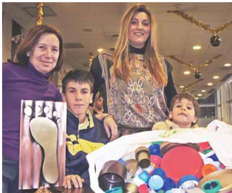
Los tapones recogidos sirven para financiar la investigación.

Esta patología se caracteriza por la degeneración del cerebelo y del sistema nervioso central. La telangiectasia es la dilatación de los vasos sanguíneos (capilares). La ataxia provoca una dificultad progresiva al andar y en el habla. Los afectados sufren inmunodeficiencia (son más sen-