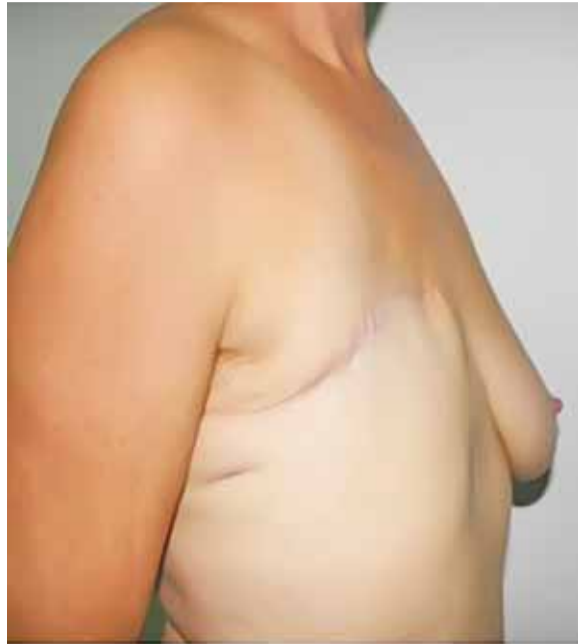
Extirpada la mama por cáncer.

La malla de polipropileno titanizado se compone de fibra de monofilamento y bordes cortados con láser. Esto hace que sea flexible, muy ligera de peso y con poca tendencia al encogimiento. Tiene alta biocompatibilidad, lo que supone una menor infla-