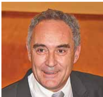
Adriá, el mejor chef del mundo.

Adriá: "La cocina puede ser un arma social de desarrollo" página 17