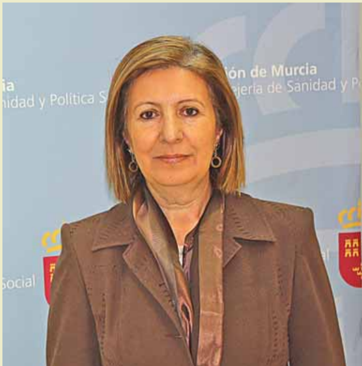
Ángeles Palacios, consejera de Sanidad y Política Social (FOTOGRAFÍA CONSEJERÍA).