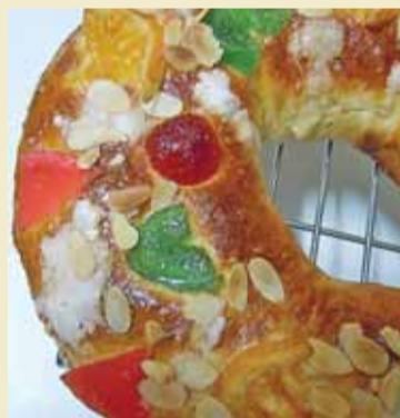
Roscón típico de Navidad.