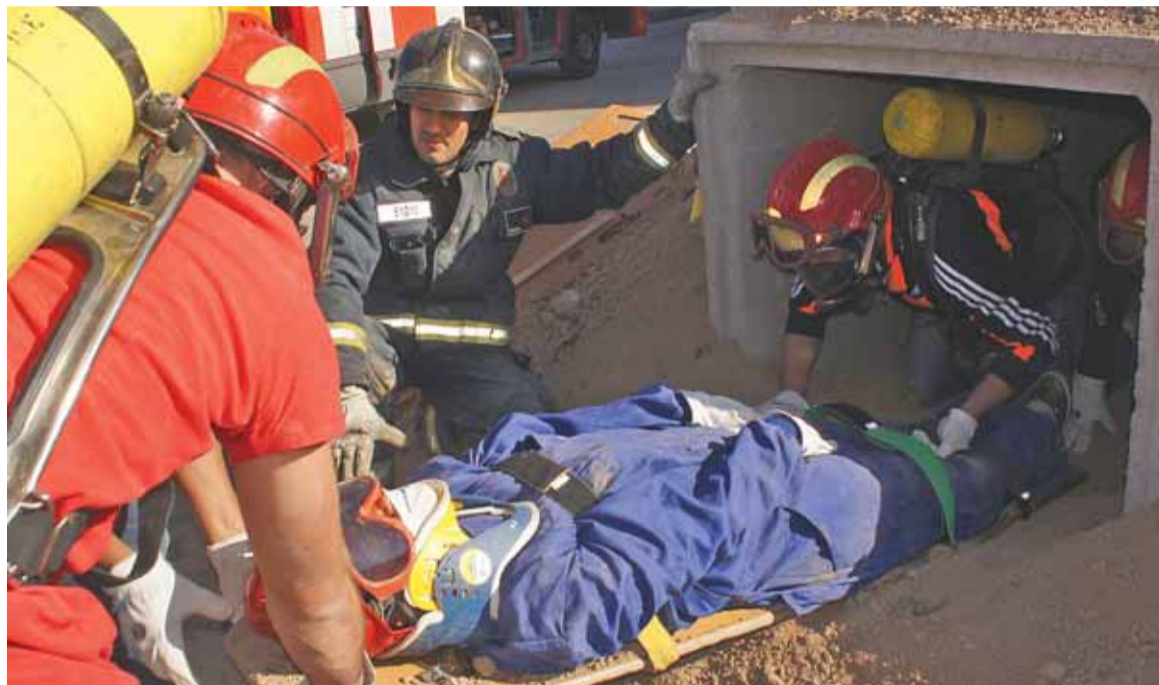
Los asistentes participaron en los talleres, como el de rescate en espacios confinados dirigido por bomberos.

ferencias y talleres, estaba enfocado a "demostrar la realidad