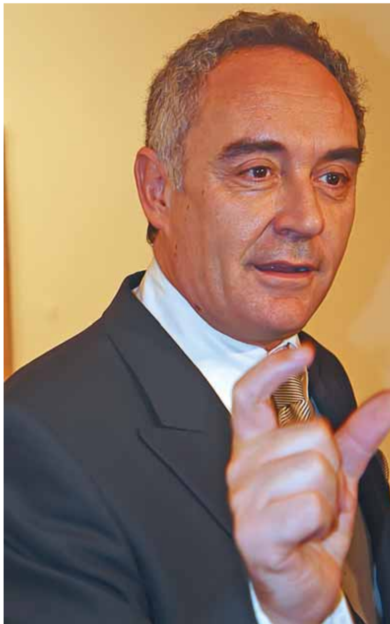
Ferrán Adriá, chef y copropietario del restaurante El Bulli.

Totalmente. Además, la prevención para mantener una buena alimentación es primordial. En el año 1900 vivíamos 35 años, ahora 82. En esa diferencia de 50 años la alimentación y el ejercicio han influido en todos los