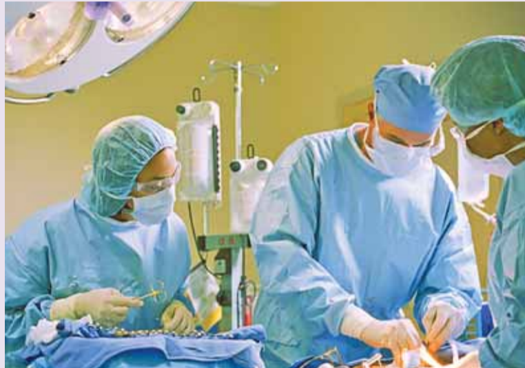
El usuario de las clínicas debe ser exigente y asesorarse convenientemente (FOTO S21).

Los médicos tenemos el derecho de cobrar por nuestro trabajo como cualquier ejercicio libre de su profesión pero, por encima de éste, tenemos un juramento de no hacer