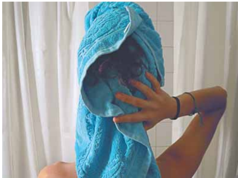
Use un champú nutritivo y séquese bien el pelo tras la ducha.

Pero la falta de hidratación es el síntoma predominante de que el pelo está dañado y sufre. Por ello, es imprescindible lavarse el pelo con un buen champú nutritivo que le devuelva su estado natural, cortarlo para sanearlo