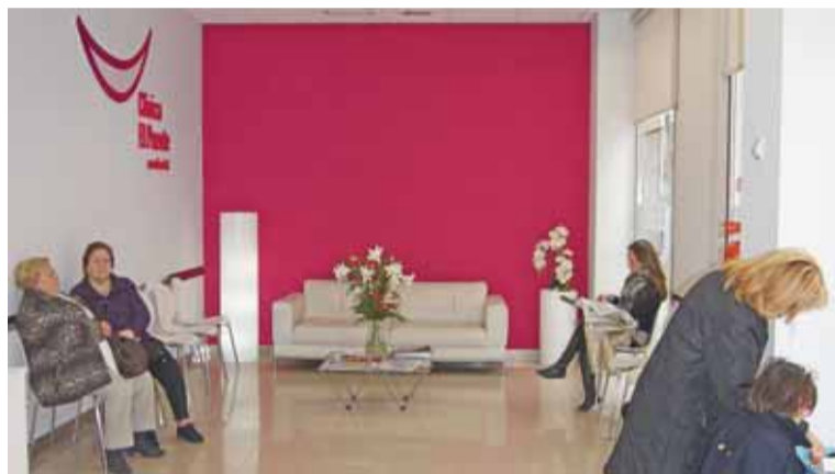
Instalaciones de la clínica ZasDental en la ciudad de Murcia.

Sus modernas instalaciones en el centro de Murcia ofrecen más comodidad y flexibilidad horaria a todos sus pacientes.